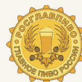
РОСГЛАВПИВО® Сообщество пивоваров и любителей пива