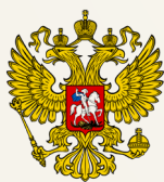
Правительство Российской Федерации