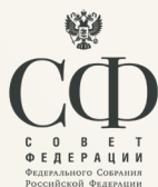
Совет Федерации Федерального собрания Российской Федерации