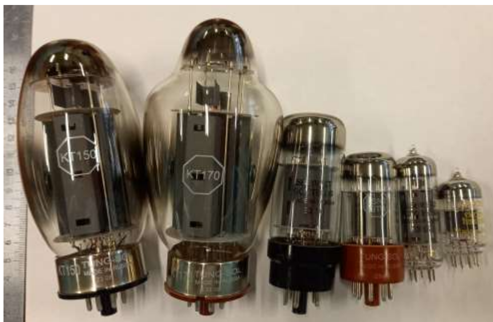
Фото 2. — Лампы цокольной и пальчиковой серий