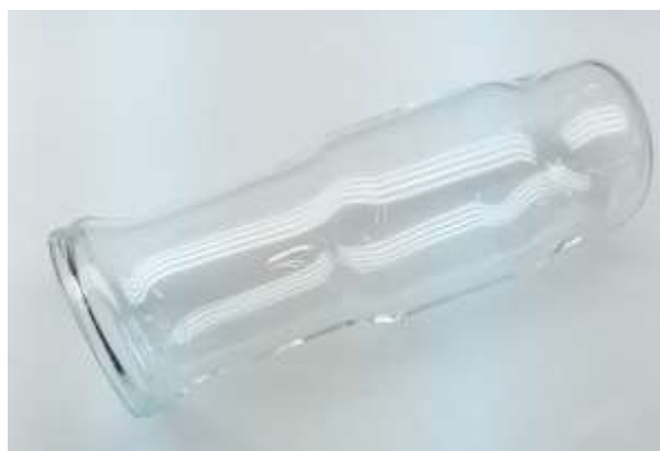
Фото 4 — Баллон лампы