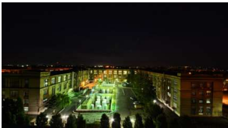
Фото 1. — АО «ЭкспоПУЛ»

В настоящее время приёмно-усилительные лампы для Hi-Fi аудиоаппаратуры производится в России на единственном предприятии АО «ЭкспоПУЛ» (фото 1), где ежемесячно выпускается 60-70тыс. ламп более 100 наименований, что составляет не менее 80% мирового рынка. На сегодняшний день приёмно-усилительные лампы приобрели вторую жизнь, так как истинные ценители музыки считают, что только ламповые усилители дают самый лучший и чистый звук. Приемно-усилительные лампы производятся в мире еще в двух странах: в Словакии (в незначительных количествах) и Китае. Китай является нашим главным конкурентом.